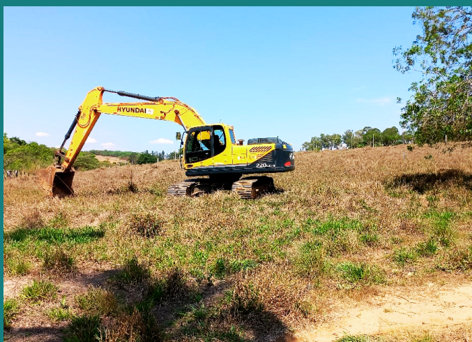
Obra de expansão AMAPÀ