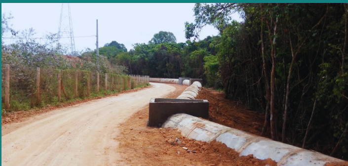
Obra de adequação e melhoria da AVIVAR