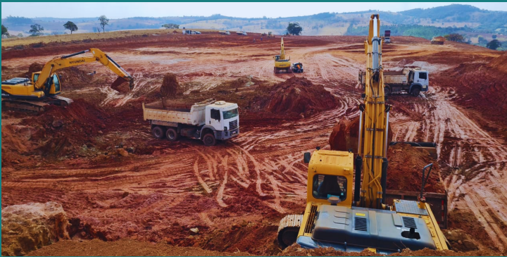
Obra de expansão da fábrica da NUTRISANTOS