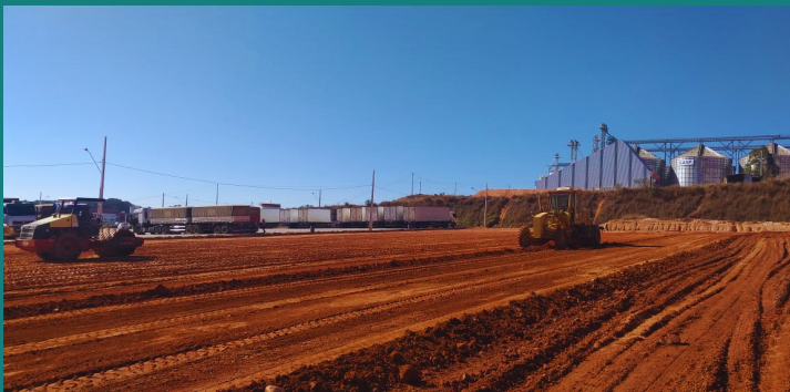
Obra de expansão da indústria da COFER