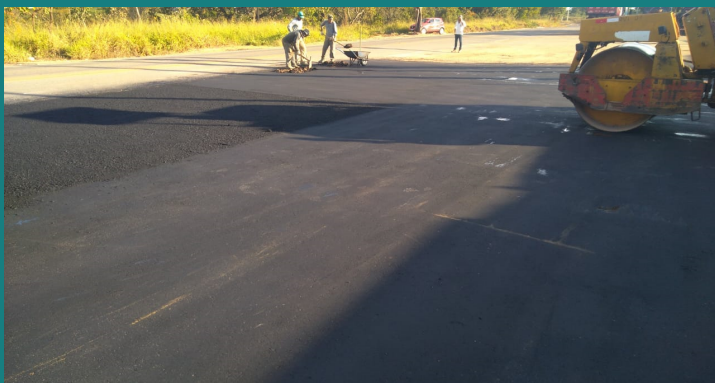
Obra de melhoria e adequação COFER