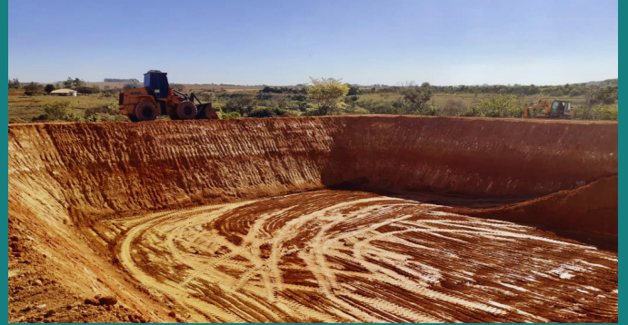
Obra de expansão da fábrica da FRIGOPATOS