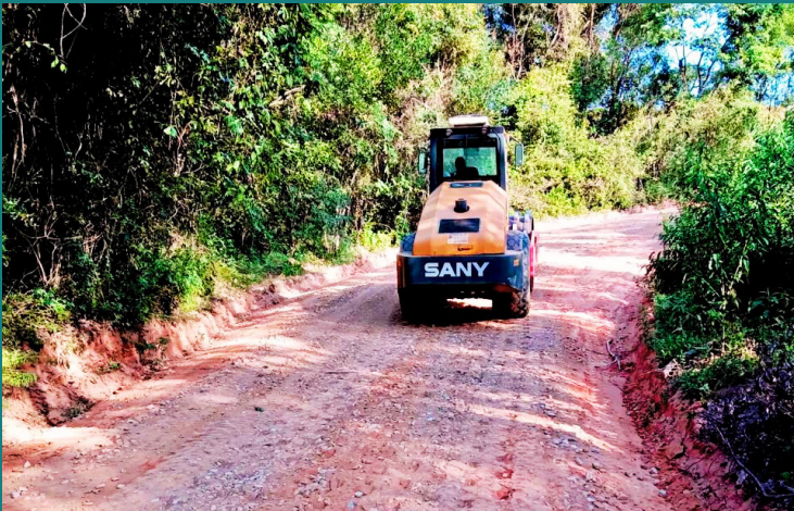
Obra de Implantação de UFV para Estrela do norte geração de energia