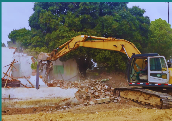
Obra de Demolição de edificação para Petrina