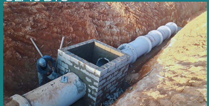
Obra de expansão da Indústria AMAPA