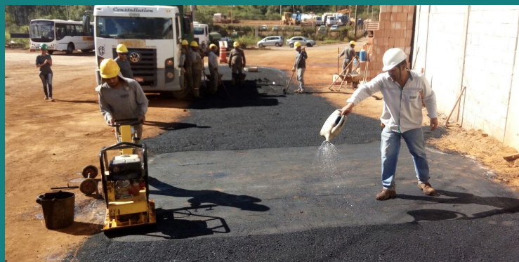
Obra de adequação e melhoria da NOVELIS