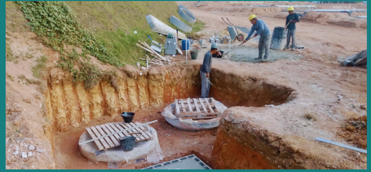
Obra de loteamento para PETRINA