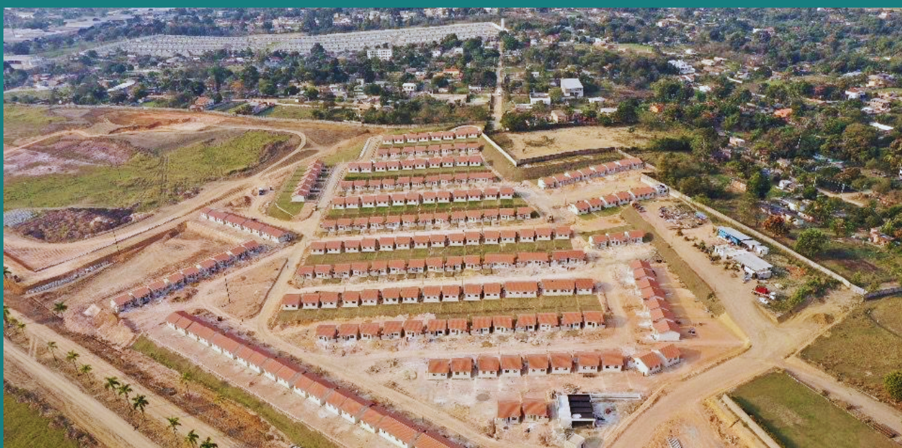
Obra de loteamento Petrina