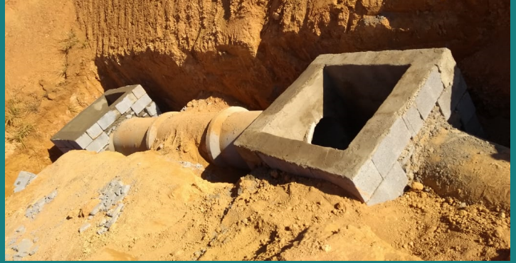
Obra de expansão da fábrica da FRIGOPATOS