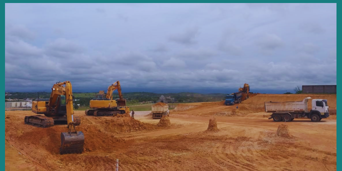
Obra de loteamento da SOW