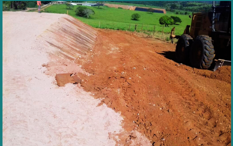
Obra SE Pedras do Indaiá para CEMIG