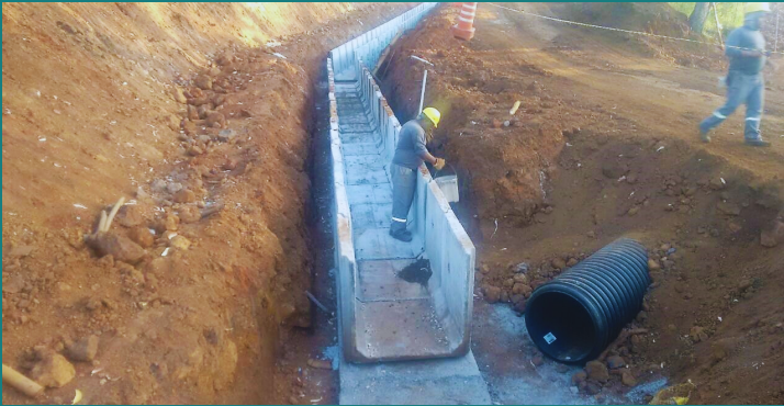
Obra de adequação e melhoria da NOVELIS