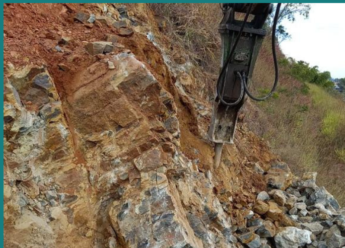
Obra de construção de acesso à Rodovia Fernão Dias da TECNOLOG