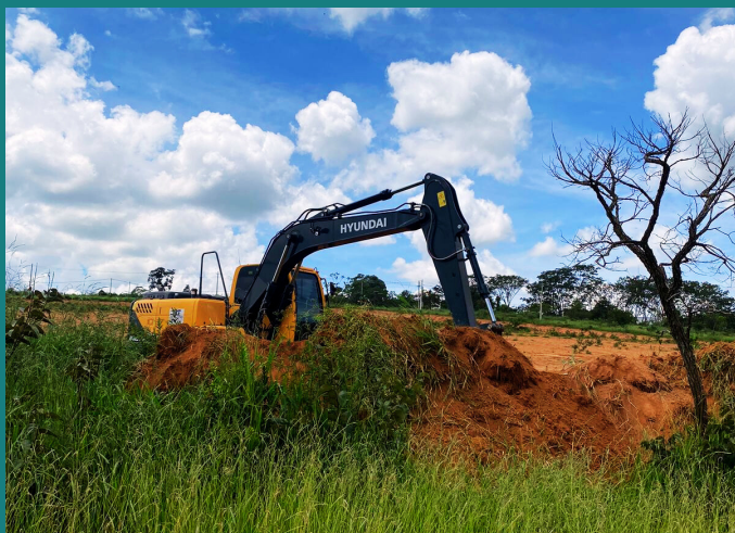
Obra de Implantação de UFV para Estrela do norte geração de energia