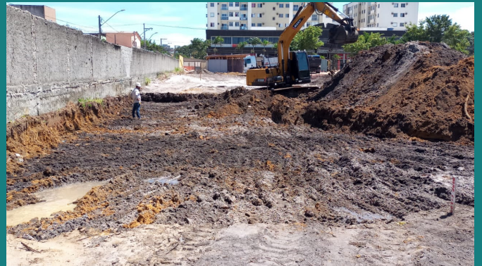
Obra de implantação EXTRA BOM