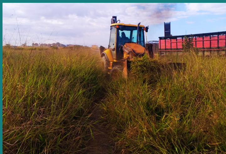
Obra de expansão FRIGOPATOS