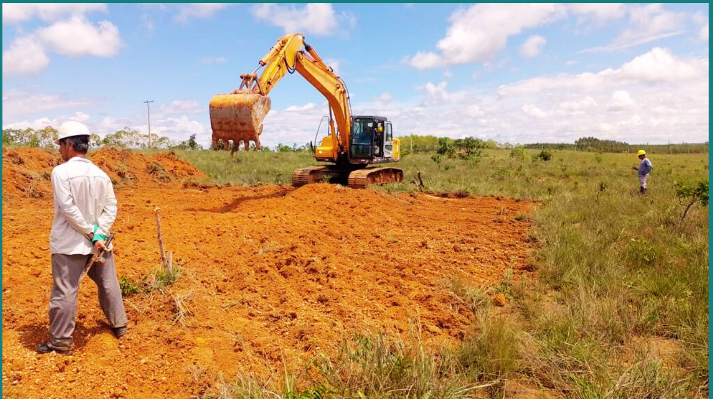
Obra de Implantação de SE - CEMIG