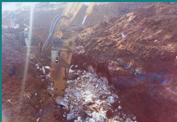
Obra de Demolição de Rocha para Novelis