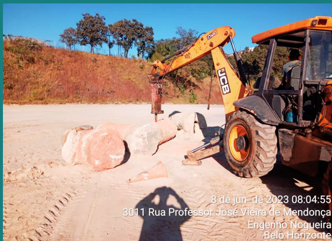
Obra Construção Templo de Belo Horizonte