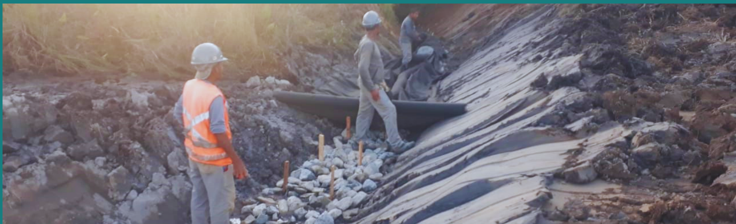
Obra de melhoria AMAPA