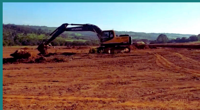
Obra Estrela do Norte Geração de Energia - Implantação de UFV