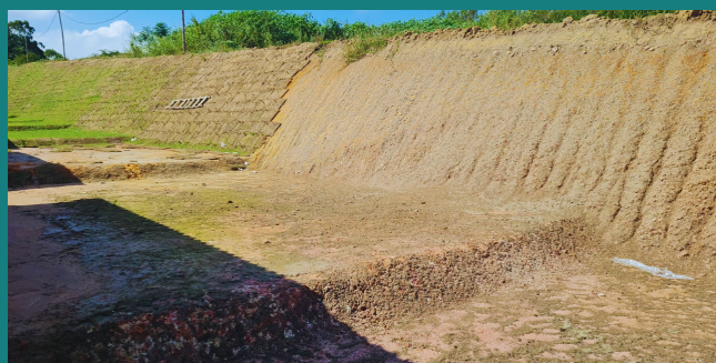
Obra de loteamento para PETRINA