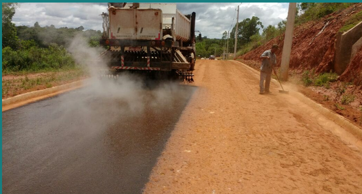
Obra de melhoria do Quarteis Bação Emp.