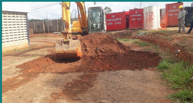
Obra de Adequação e Melhoria da Amapa