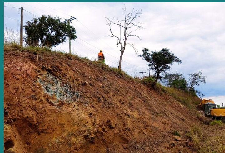
Obra de Construção de acesso à Rodovia Fernão Dias - TECNOLOG