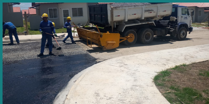
Obra de loteamento para PETRINA