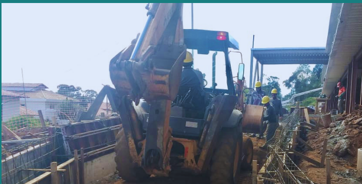
Obra de implantação do HOSP. ONCOMED