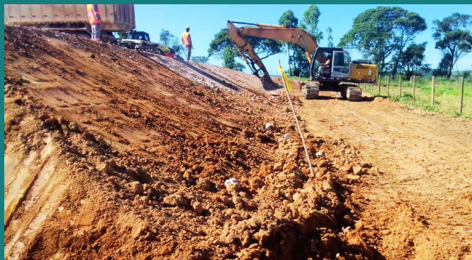
Obra SE Pedras do Indaiá da CEMIG