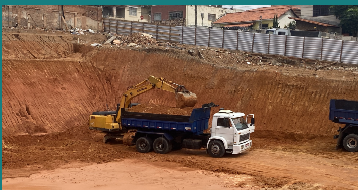
Obra de implantação VILLEFORT