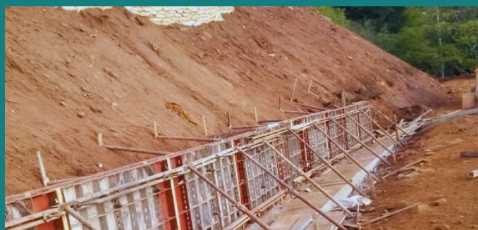
Obra de implantação do HOSP.ONCOMED