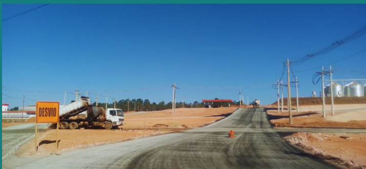
Obra de adequação e melhoria da AVIVAR